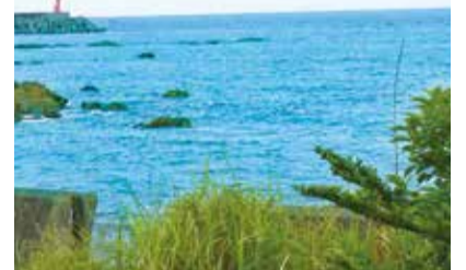
高知県黒潮町の海

冷凍魚は下処理後、バラ凍結し、そのままワンフローズンでお届けしています。 加工品は冷凍していた魚を半解凍し、水洗い、腹出し、あるいは3枚おろしなどを行っています。