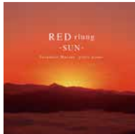
赤いルン Red lung -SUN-