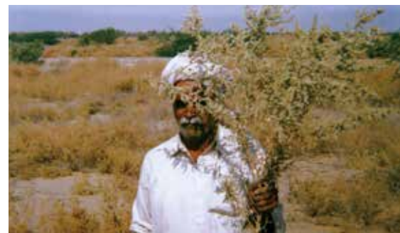
サッジカールの採取風景